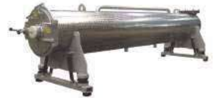
ÖZEL ÖLÇÜLERDE SIKMA MAK.