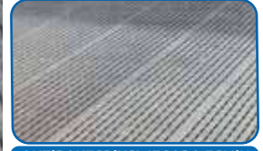
ANTİBAKTERİYEL İZGARA ZEMİN