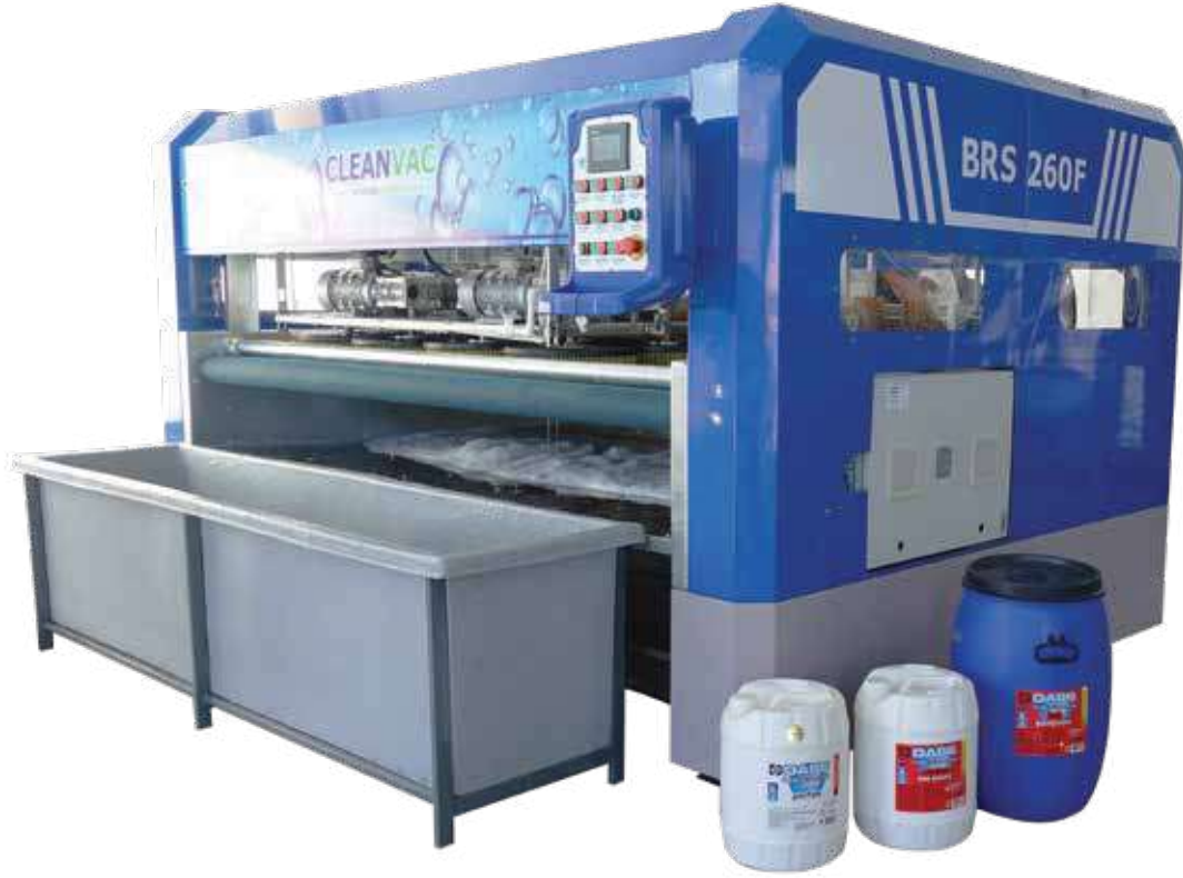
CLEANVAC BRS 260-F