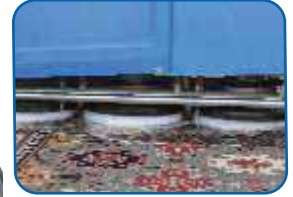
FİRÇA BASKI AYARI