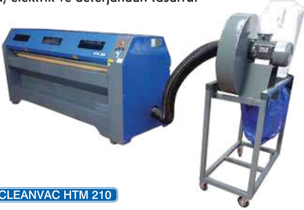
CLEANVAC HTM 210