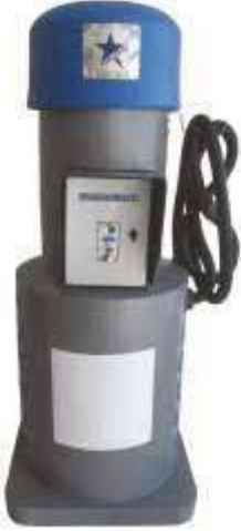
CLEANVAC HP 220SS