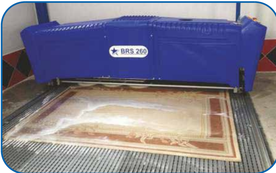
CLEANVAC BRS 260