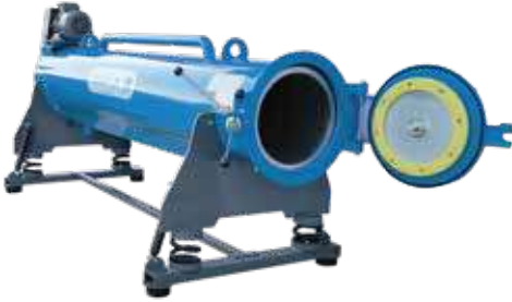
CLEANVAC RL 1400 A