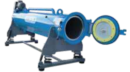
CLEANVAC RL 1200 A