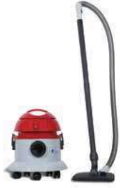
CLEANVAC ECO 21