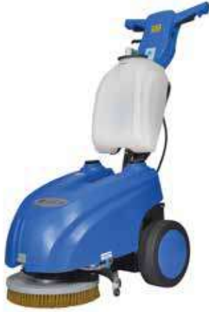
CLEANVAC ESC 42