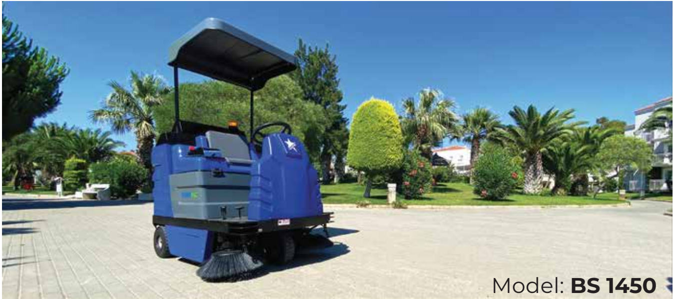
Model: BS 1450