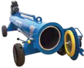
CLEANVAC RL 1200