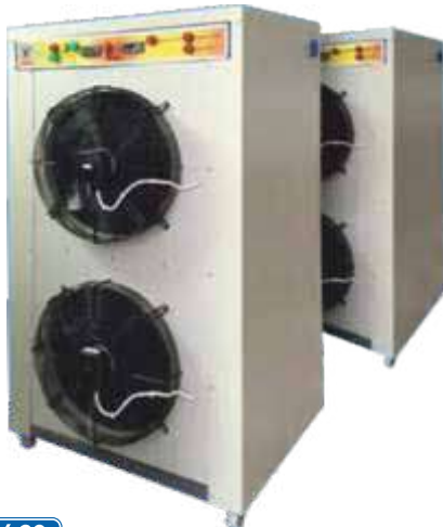
CLEANVAC DRY 60