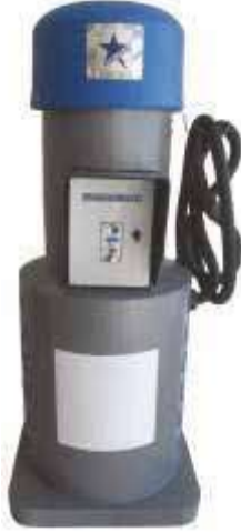
CLEANVAC WD 602SS