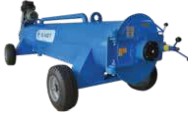
CLEANVAC RL 1400 T