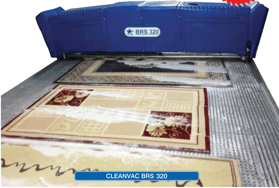
CLEANVAC BRS 320